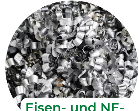
Eisen- und NE- METALLE