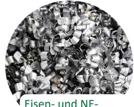
Eisen- und NE- METALLE